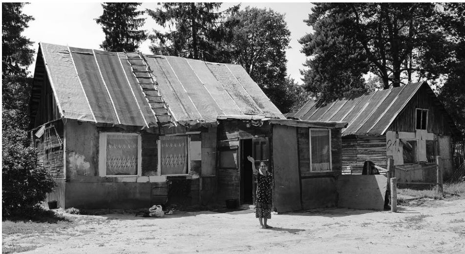
Porubanka, osada romska w Wilnie